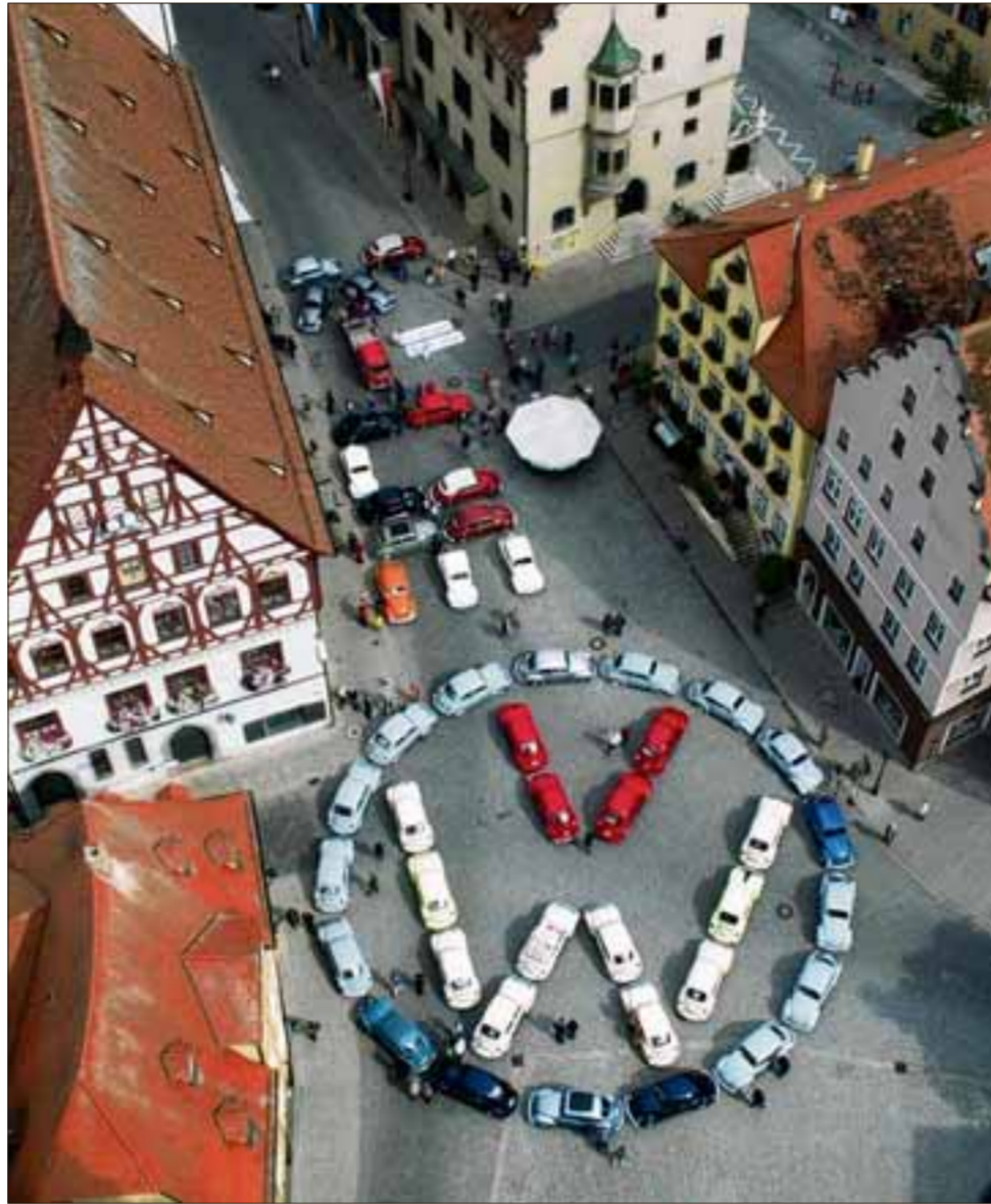
Die hellblauen und beige Käfer gehören zu den Käfern, die am allerletzten Tag in Mexiko hergestellt wurden. Aus einer früheren Sonderedition kamen ganze drei limonengrüne Modelle nach Deutschland – zwei davon befanden sich gestern auf dem Nördlinger Marktplatz in der Mitte der äußeren „W“-Aufstriche.